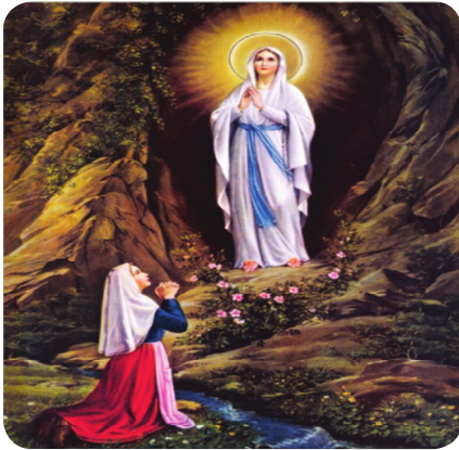
படம் 22.3 - லூர்து நகரில் மரியன்னை காட்சியளித்தல்