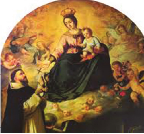
படம் 22.1 - டொமினிக் குஸ்மான் அடிகளாருக்கு மரியன்னை காட்சியளித்தல்

டொமினிக் குஸ்மான் அடிகளாருக்கு மரியன்னை காட்சியளித்தல்